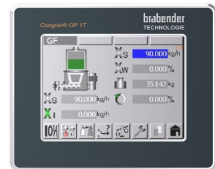
Congrav® OP 1T

Weitere Details entnehmen Sie bitte der entsprechenden separaten Werksnorm.