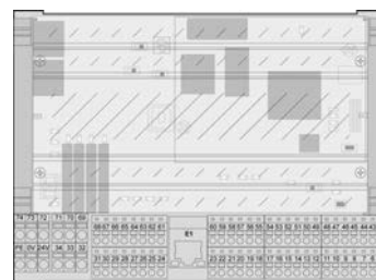
Steuermodul Congrav® CB plus