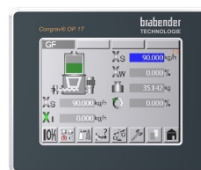
Bedieneinheit Congrav® OP 1T

Der OP 1T ist alternativ einsetzbar als Wartungs-, Diagnose- und Parametriereinheit zum lokalen Anschluss an das Steuermodul Congrav® CB plus, wenn dieses direkt mit einem kundenseitigen Host-/SPS-System verbunden ist, oder an Steuermodule Congrav® CB plus in Mehrkomponenten-Dosiersystemen.